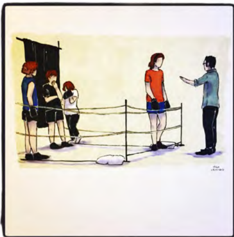
Dessins : Max

Un autre extrait sera présenté dans l'espace du CSC Grand Nord à partir de 20 h 15.