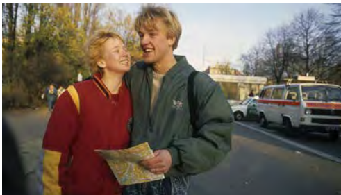
Jeune couple de Berlin-Est licitant pour la première fois Berlin-Ouest, deux jours après la chute du mur.