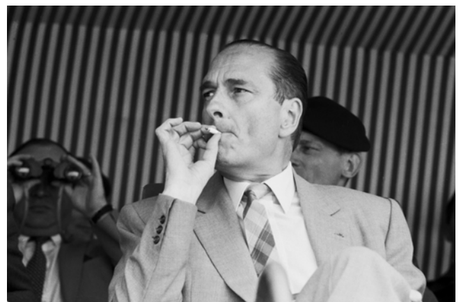
Jacques Chirac.