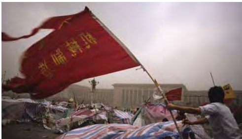
Place tian An Men, mai 1989.

Présenté ensuite en continu dans l'Espace du CSC Grand Nord.